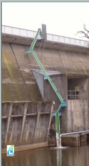
Barrage Rochereau, Lay \Delta h = 11.00 m

Les systèmes de fixation peuvent être également fournis.